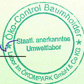
Armin Walther Lebensmittelchemiker